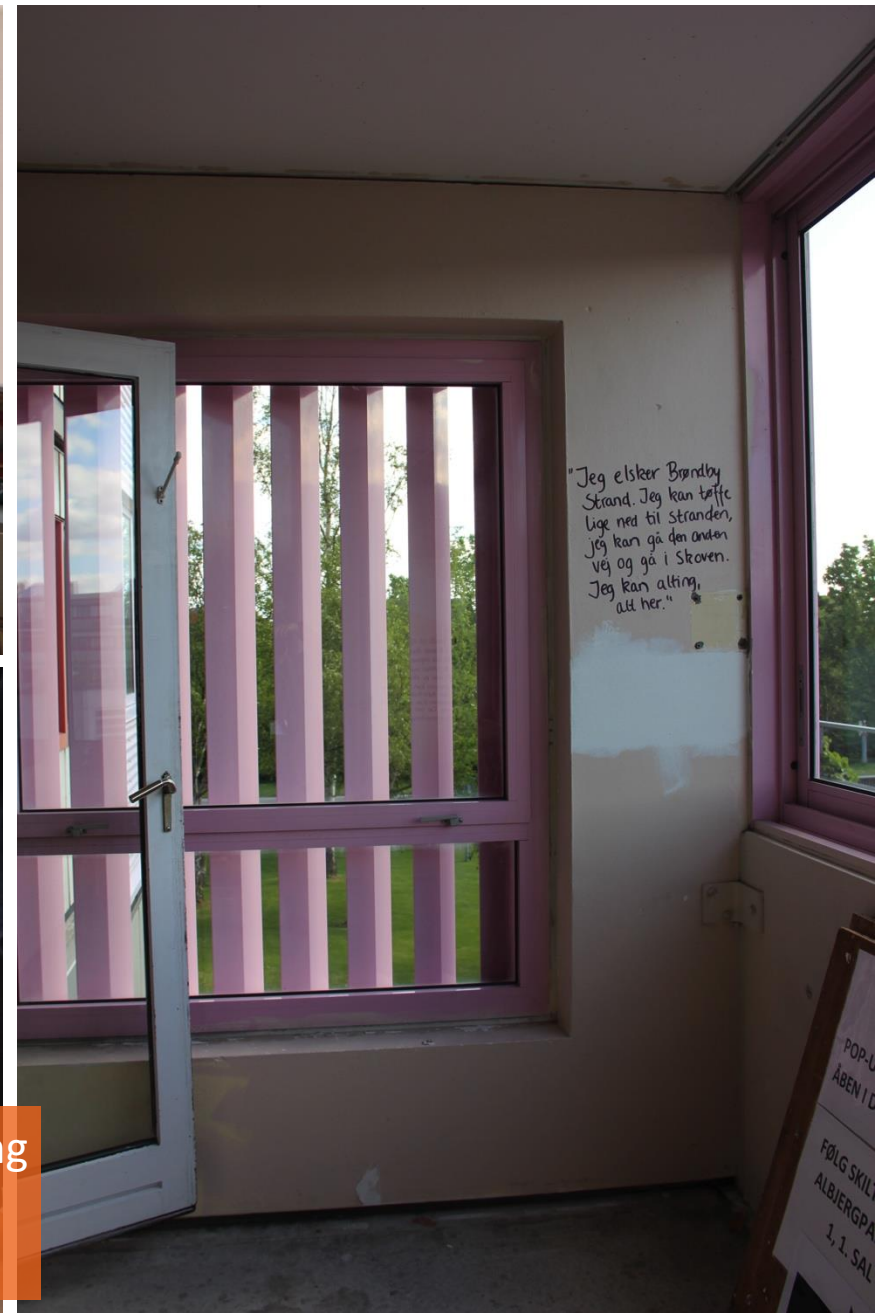
En af de tomme lejligheder var midlertidigt indrettet som en pop-up udstilling om højhusenes historie. På væggene stod citater fra beboere om deres forhold til Brøndby Strand.